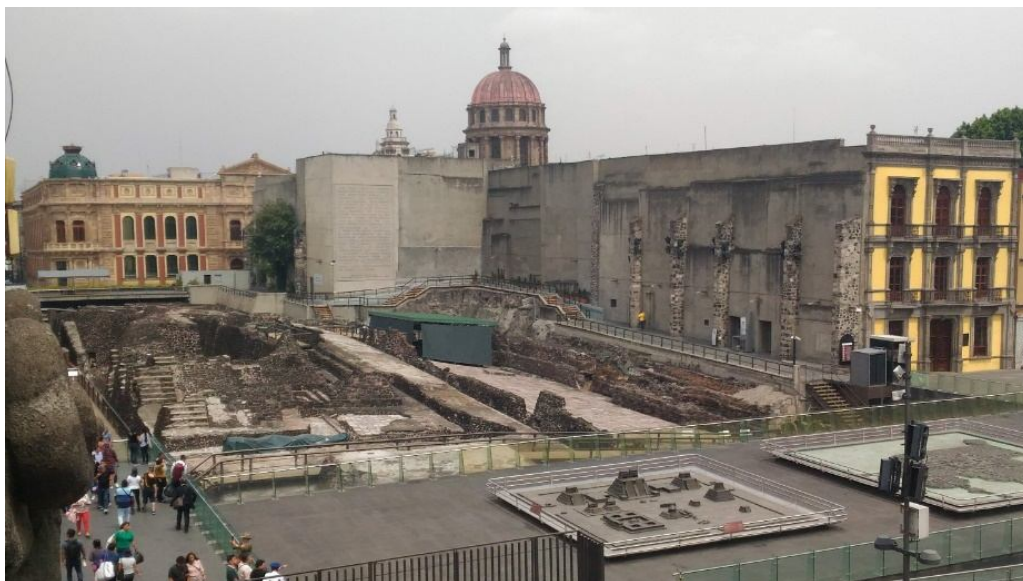
Ciudad de México, Tenochtitlan, antiguo Templo Mayor a un costado de la Catedral Metropolitana (2019)

Un caso absolutamente interesante es el de Ciudad de México con el descubrimiento del antiguo recinto sagrado de Tenochtitlan con el Templo Mayor a un costado de la Catedral Metropolitana, cuyos vestigios dieron vida a un ejemplo de estratificación histórica que hoy permite recrear una “biografía urbana” que fue interrumpida a partir del siglo XVI en el periodo de la colonización europea (Barrera J.A., Islas Domínguez A., 2018).