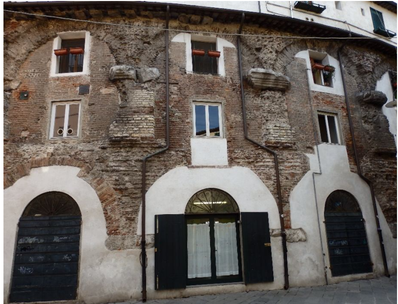
(A la izquierda) Ancona, área arqueológica y estratificación medieval (2019)