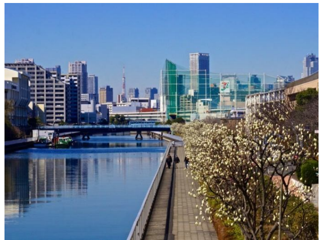
(A la izquierda) Tokio, antiguo mapa del periodo Edo (siglo XVIII) (A la derecha) Tokio, un canal de la ciudad (2019)

Cuando se observan las distintas realidades urbanas en el mundo resulta fundamental realizar investigaciones científicas que puedan dar de nuevo valor a la historia de los asentamientos y, por consiguiente, favorecer la re-escritura de las nuevas biografías de las ciudades. Es necesario escribir biografías que no pongan solamente en valor el pasado de modo pasivo, sino que desde este pasado estén en grado de brindar respuestas al presente a fin de contribuir a construir de mejor forma el futuro. La “biografía urbana” tiene valor, de hecho, si logra interactuar y dialogar con todos los paradigmas culturales que intervienen en la formación de la ciudad con la finalidad de conocer y valorar su propio patrimonio cultural. El retraso de estas re-escrituras biográficas da como resultado ciudades contemporáneas que no responden a las necesidades del hombre sino a algo que construyeron de forma artificiosa y de las cuales todos se sienten excluidos ya que la ciudad y sus usos no están más a escala humana.